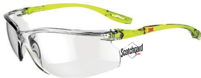
SCCS01SGAF-GRN Zorník: Číra