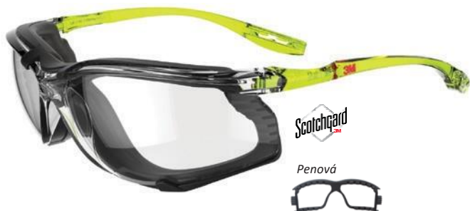
SCCS01SGAF-GRN-F Zorník: Číra