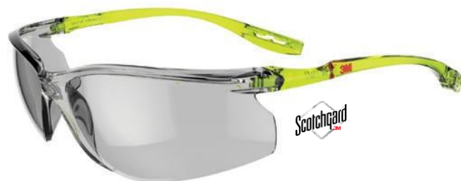
SCCS07SGAF-GRN Zorník: Sivý, I/E