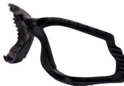
71511-99999 Penová vložka