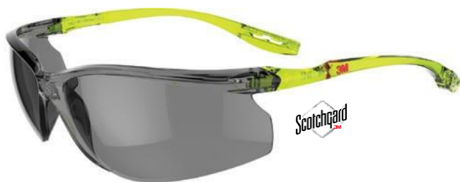
SCCS02SGAF-GRN Zorník: Sivá