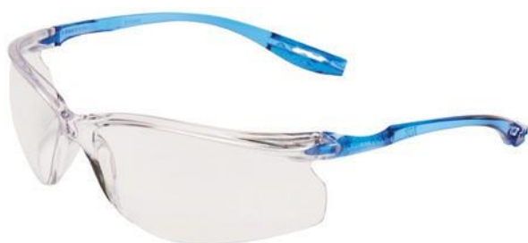
71511-00000 Zorník: Číra